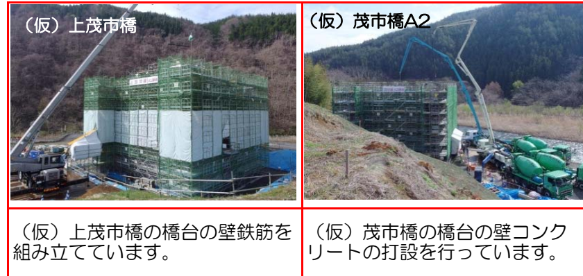
③施工：戸田・岩田地崎JV