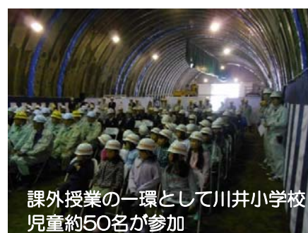
課外授業の一環として川井小学校児童約50名が参加