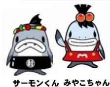
サーモンくん みやこちゃん