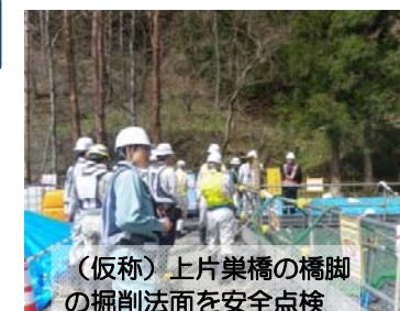
(仮称)上片栗橋の橋脚の掘削法面を安全点検

宮古箱石道路安全協議会では、4月14日(木)に労働基準監督署長と専門官の2名に来現いただき安全パトロールを実施しました。安全パトロールは工事事故を未然に防止することを目的としております。今後も定期的にパトロールを実施し、無事故、無災害に努めていきます。