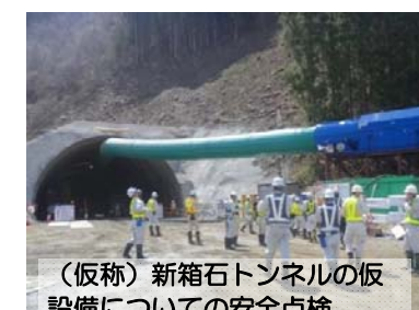
(仮称)新箱石トンネルの仮設備についての安全点検